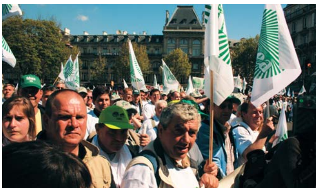
Comité de suivi des Grandes cultures : de nombreuses attentes

Ces groupes se sont réunis pour la première fois fin avril. Dans chacun d'eux, ORAMA a insisté sur l'urgence pour les Pouvoirs publics de devoir répondre très rapidement à diverses demandes, compte tenu de la situation économique des exploitations. Il s'agit de dynamiser le marché (mise en œuvre de garanties de crédit-export, relèvement du taux d'incorporation de biocarburants, par exemple), de réduire l'encombrement actuel des silos (location de capacités de stockage à l'intervention