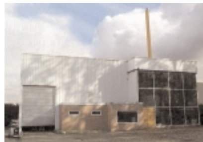
Unité de chauffage à base de paille pour logements HLM à Villeparisis (77)

sur jachère pour ce type d'utilisation sur les exploitations mêmes –, l'économie s'élèverait à 12 t. Tous ces chiffres sont en « net » : le CO 2 généré par la fabrication des engrais et des autres intrants, par la culture du blé, la collecte, le transport et la transformation (éthanol) de la récolte est compté. À raisonner seulement en termes d'effet de serre, les produits pétroliers n'auraient plus guère de succès. Mais à 25 ou 30 $ le baril, ils restent encore intéressants par rapport à des produits d'origine céréalière. La lutte contre l'effet de serre pourrait cependant changer la donne, en conduisant les gouvernements, d'une part, à imposer l'utilisation de produits non pétroliers dans les carburants et, d'autre part, à instituer des éco-taxes qui rééquilibreraient les prix entre énergies. ■